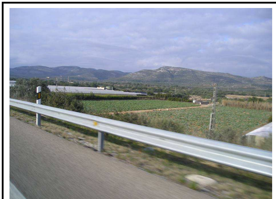
Fotografía 11.- Perspectiva desde la N-340 de los terrenos donde se construirá la EDAR