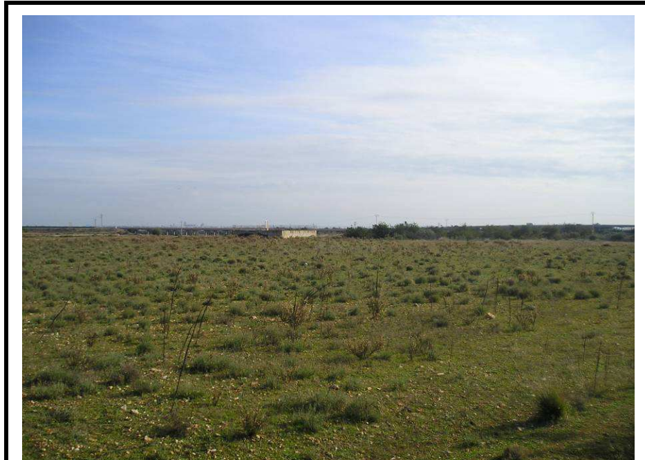
Fotografía 21.- Vista general de la parcela en dirección sureste