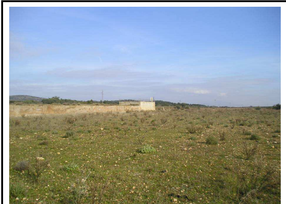
Fotografía 17.- Balsa de riego y muro