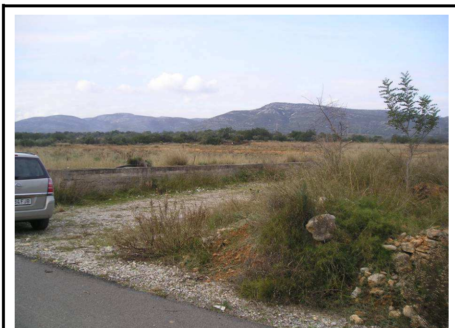
Fotografía 24.- Parcela desde el Camí Molinés. Punto de acceso a la EDAR