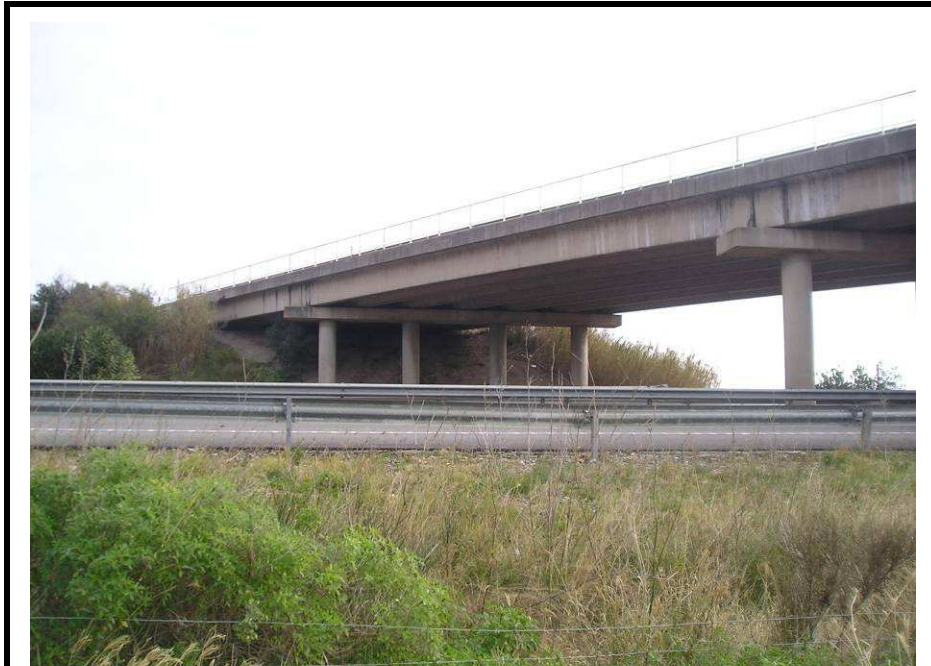
Fotografía 9.- Ubicación de la segunda hinc. N-340