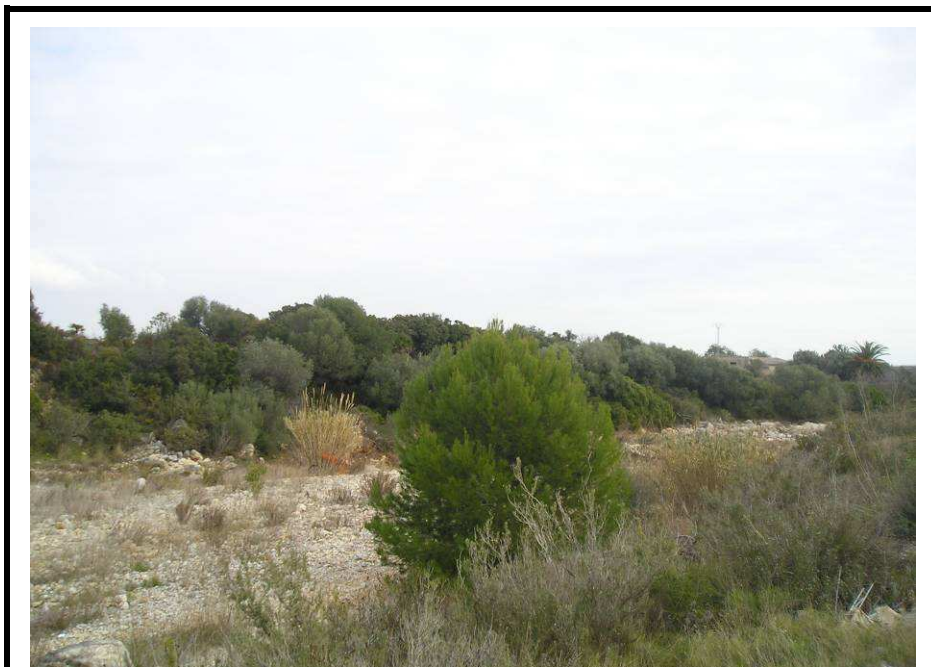
Fotografía 26.- Nueva vista de la parcela desde la rambla