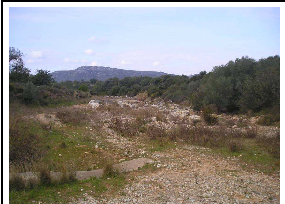
Fotografía 27.- Rambla de Alcalá. La parcela a la derecha