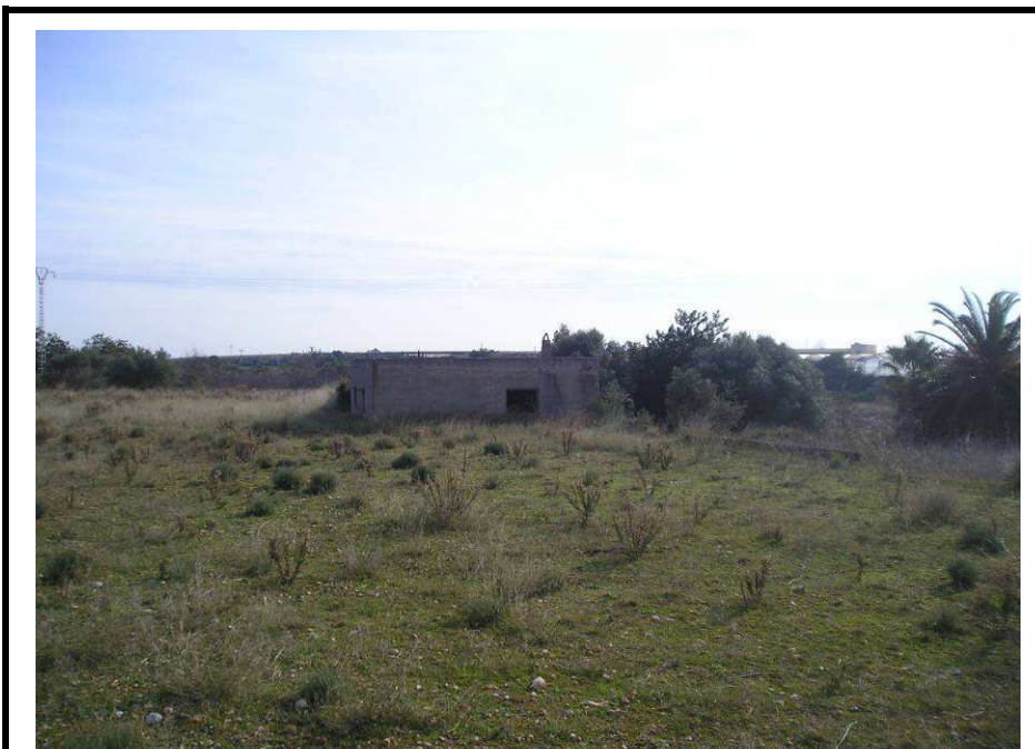
Fotografía 16.- Edificación existente junto al Camí Molinés. Se ha previsto su demolición