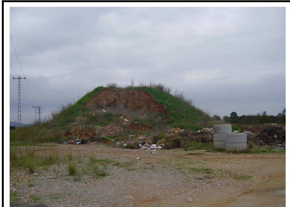
Fotografía 7.- Parcela de la futura EBAR Vial Benicarló