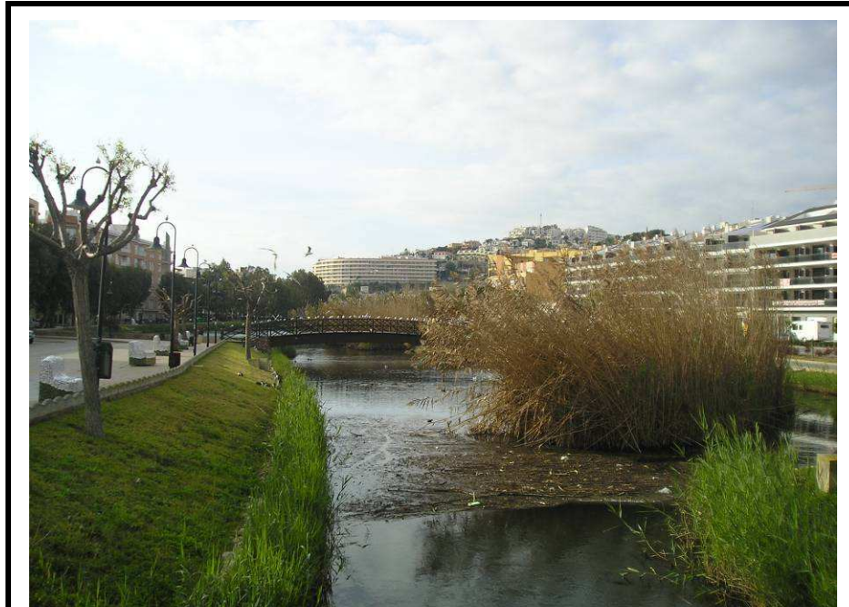
Fotografía 3.- Vista del Estany de Peñíscola