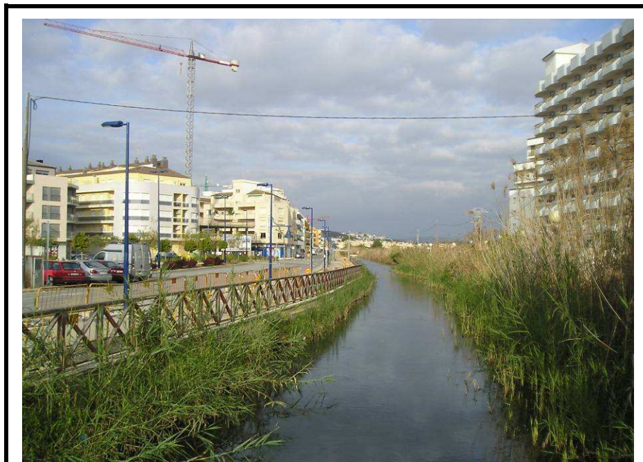
Fotografía 4.- Vista de la calle Pigmalión, por la que discurrirá la impulsión desde la EBAR