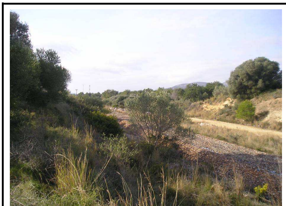
Fotografía 20.- Límite noroeste de la parcela. Antigua plataforma del ferrocarril