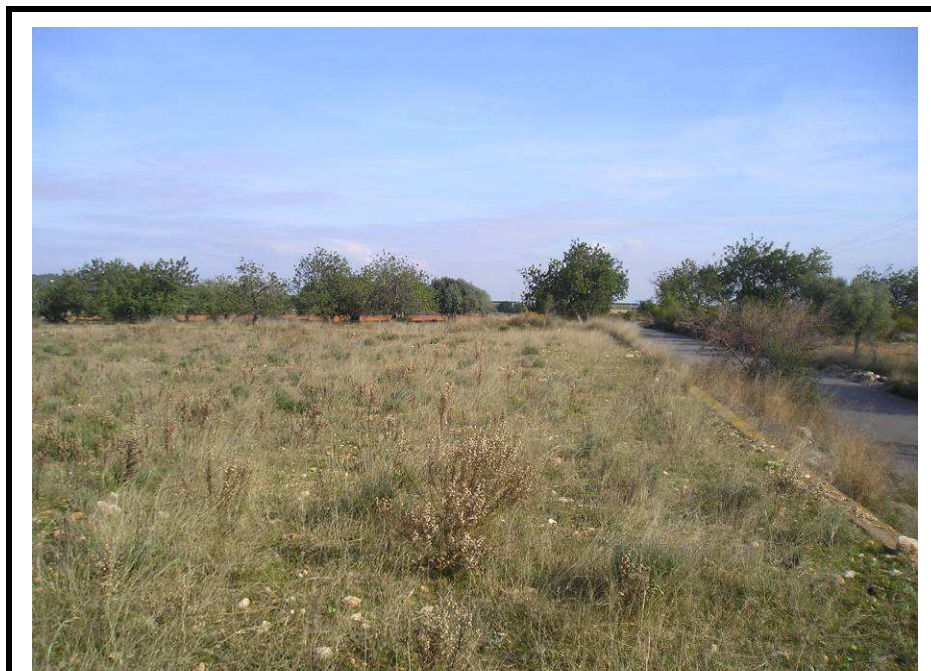
Fotografía 13.- Límite sureste de la parcela, donde se ha previsto el acceso a la EDAR. A la derecha el Camí Molinés