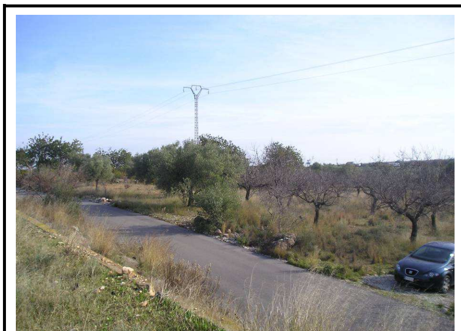
Fotografía 14.- Línea eléctrica desde donde se derivará la alimentación a la EDAR