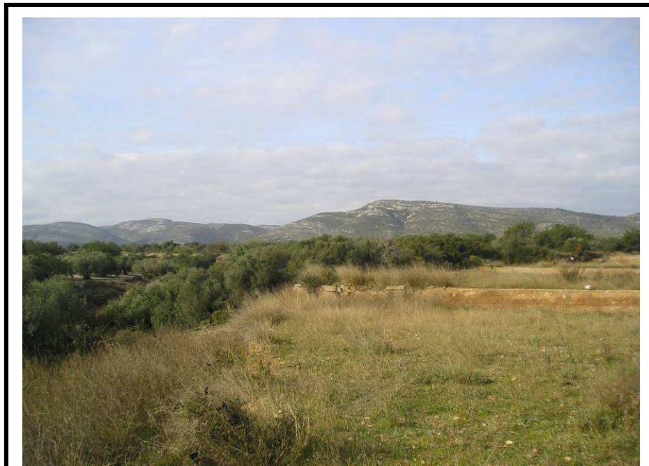
Fotografía 15.- Límite suroeste de la parcela. A la izquierda el terraplén que desciende hasta la rambla de Alcalá