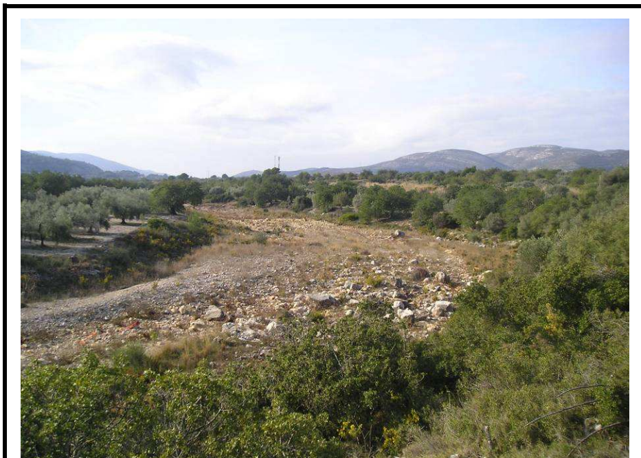
Fotografía 18.- Rambla de Alcalá vista desde la parcela de la EDAR