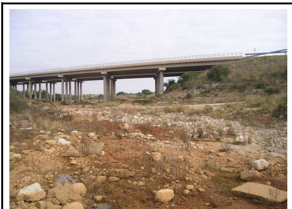
Fotografía 10.- Ubicación de la tercera hinc. AP7