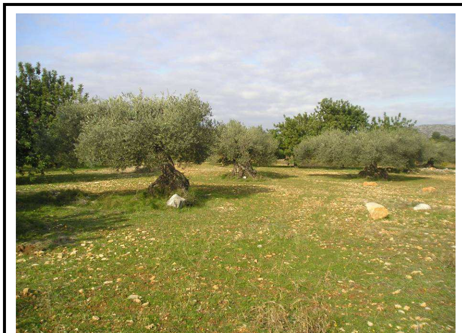
Fotografía 19.- Campo de olivos de gran valor en la terraza más elevada de la parcela