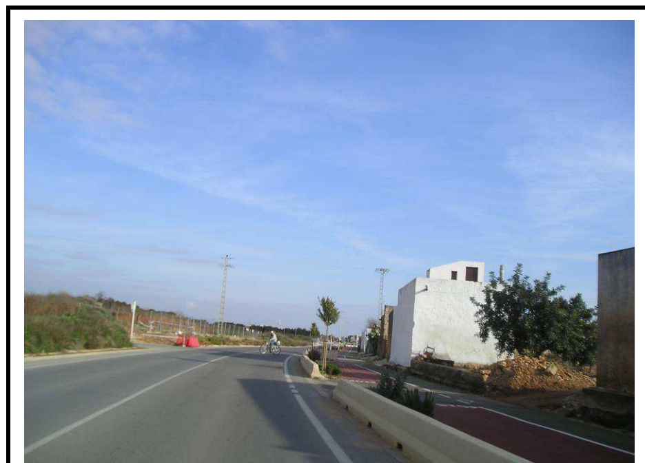
Fotografía 6.- Carretera Peñíscola – Benicarló. Al fondo y a la izquierda la parcela de la futura EBAR