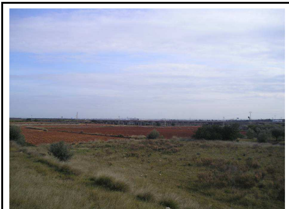
Fotografía 23.- Límite noreste de la parcela. Se aprecian tres niveles de terrazas. Al fondo la AP7