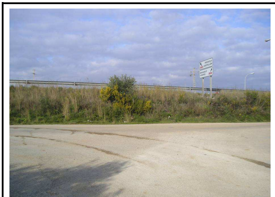
Fotografía 8.- Ubicación de la primera hinca. Enlace entre la AP7 y la N-340