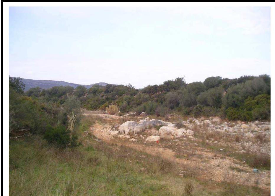
Fotografía 25.- Parcela vista desde el margen opuesto de la rambla de Alcalá. Obsérvese los afloramientos rocosos