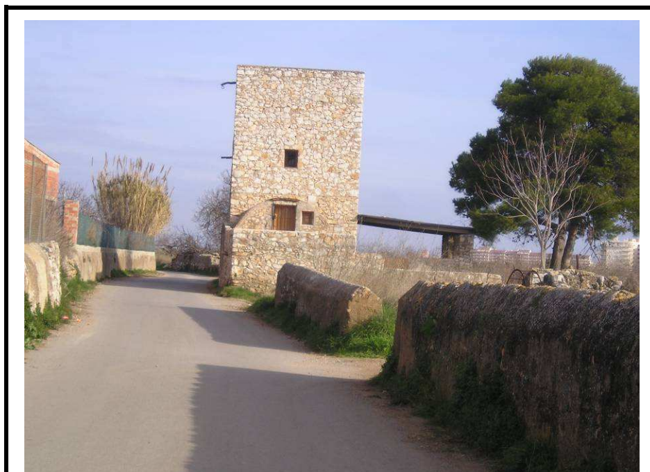
Fotografía 5.- Vista del camino por el que discurrirá la impulsión junto al marjal de Peñíscola